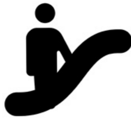
こまめな館内設備の消毒