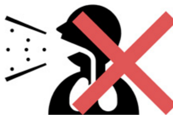
咳エチケットのご協力