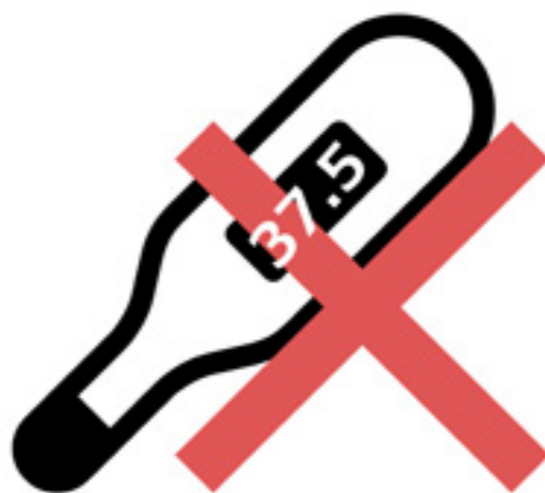
お客様自身の体調チェック

●お客様の体調不良時のご利用はご遠慮いただきますようお願いいたします また、下記項目につきましてご協力のほどお願いいたします