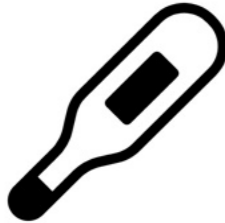
出勤前の体温測定を徹底