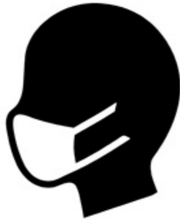
従業員のマスク着用推奨

●当施設ではお客様に安心してお買い物・お食事していただくために、以下の予防対策を実施しております