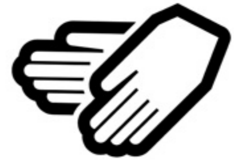
定期的な手洗い、手指消毒